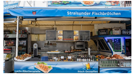
Free Willy - © Free Willy