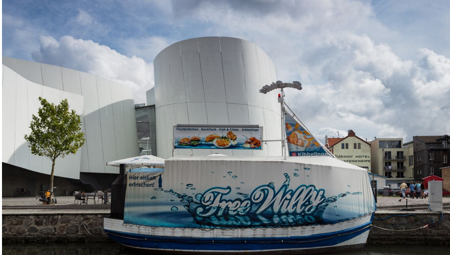
Free Willy - © PapadoXX-Fotografie, Free Willy