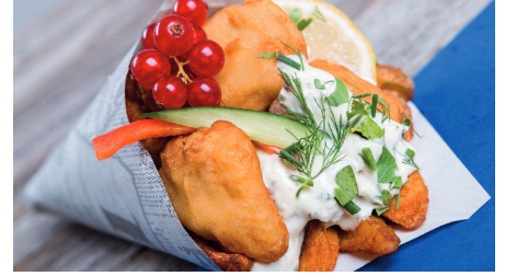
Genusskutter Free Willy