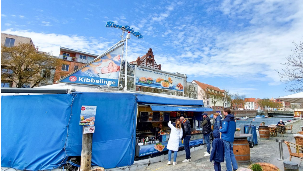
Genusskutter Free Willy