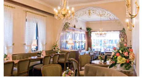
https://imagesim-webdeobjekt-picsobj-full-31690-016.jpg