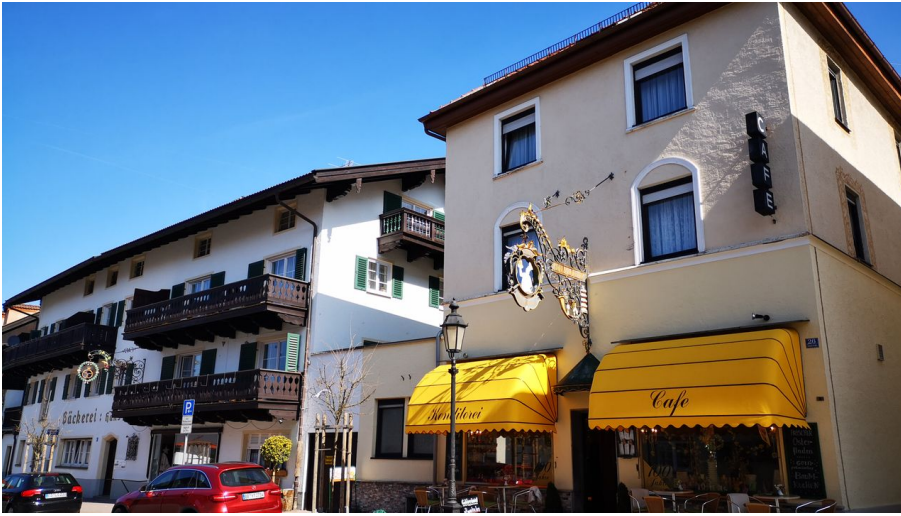
Die Konditorei mit Café