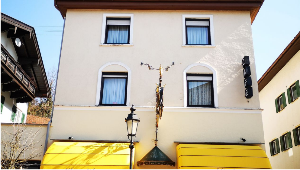
Das Café in der Hauptstraße