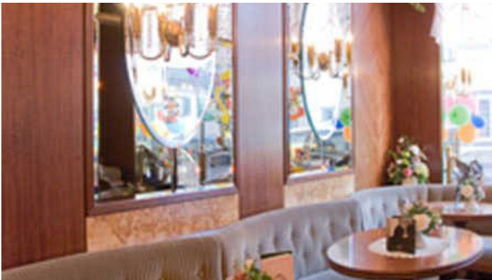
https://imagesim-webdeobjekt-picsobj-full-31690-017.jpg