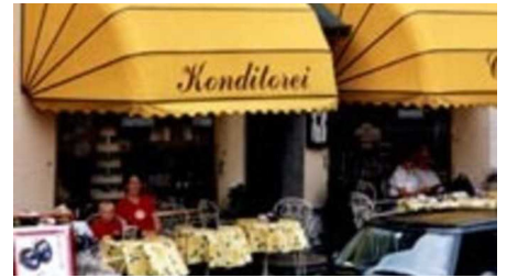
https://imagesim-webdeobjekt-picsobj-full-31690-015.jpg