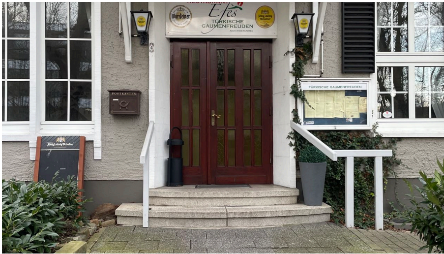
image00050.jpeg - © Minden Marketing GmbH