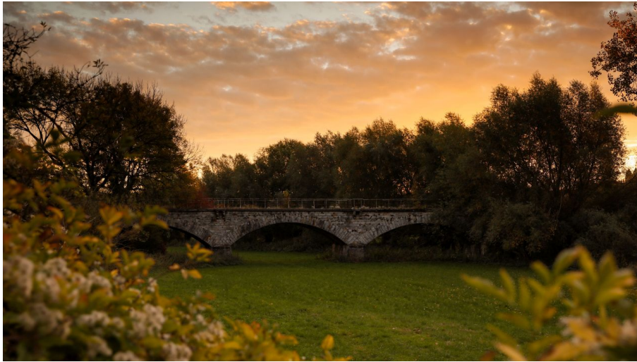
Nordborchen Viadukt