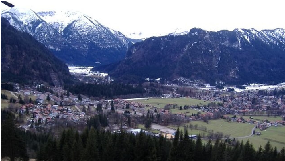
Blick auf Oberammergau