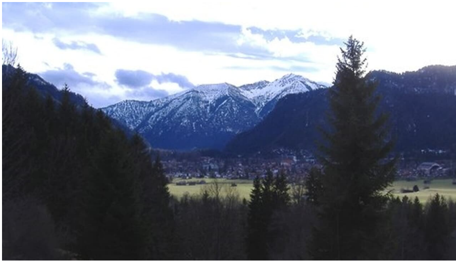
Ausblick vom Kühlberggraben