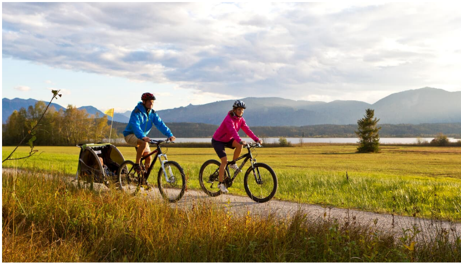
471_Murnau Tourismus_471 - Tourist Information Murnau