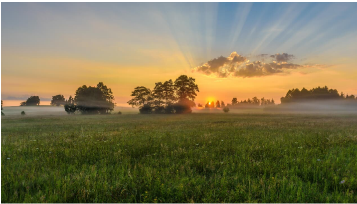
Sonnenaufgang im Murnauer Moos 1 - Wolfgang Ehn - Das Blaue Land / Wolfgang Ehn