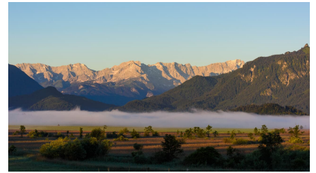
Murnauer Moos von der Kottmüllerallee - Wolfgang Ehn - Das Blaue Land / Wolfgang Ehn