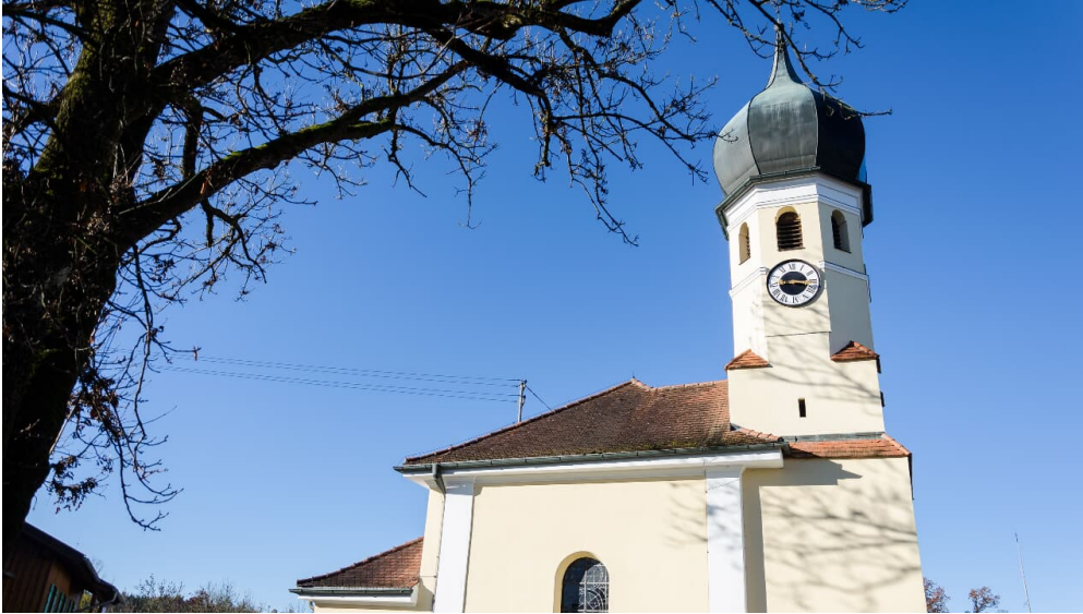
hndl - Simon Bauer - Das Blaue Land / Simon Bauer