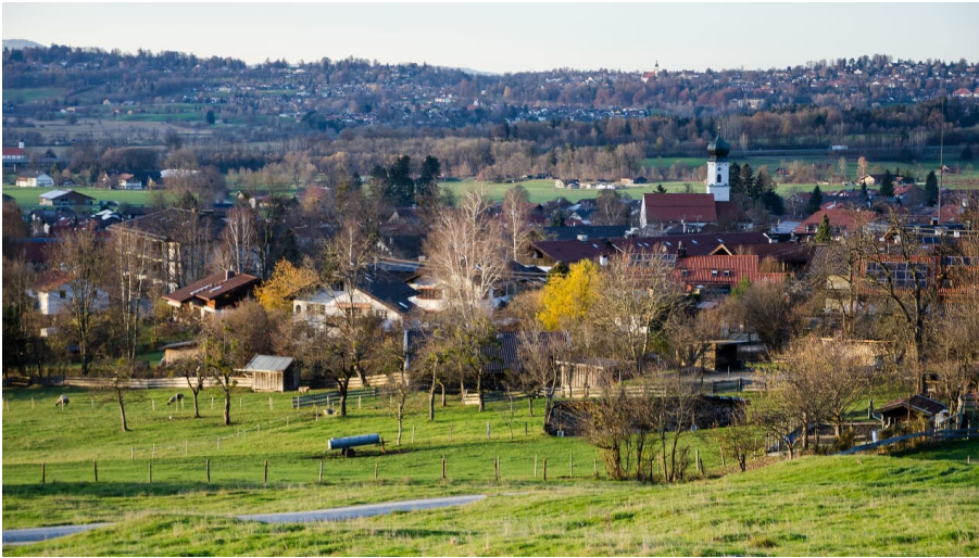
Blick auf Ohlstadt und Murnau - Simon Bauer - Das Blaue Land / Simon Bauer