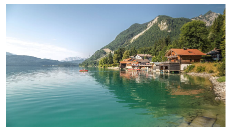
Urfeld_Walchensee_13-TKujat (1)