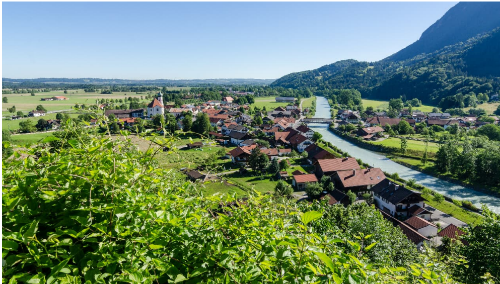
Calvarienberg in Eschenlohe - Simon BAuer - Das Blaue Land / Simon Bauer