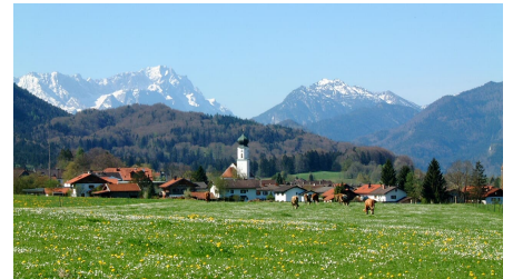
Gästeinfo - Gäste Info Ohlstadt