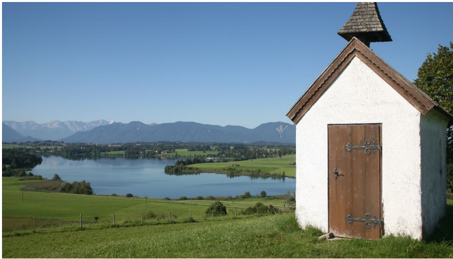
Riegsee-Mesnerhauskapelle - Das Blaue Land / Simon Bauer