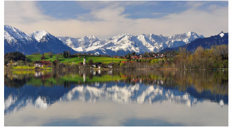
Riegsee_Panorama1 - Jörg Lutz