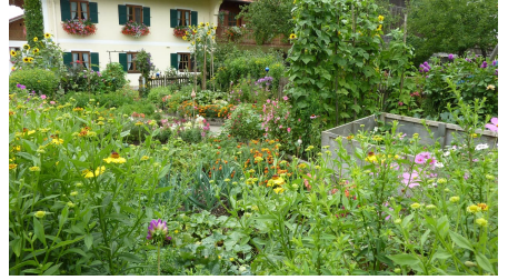
Bauergärten in Riegsee neben der Kirche - Tourist Information Riegsee