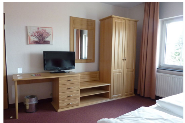
Hotel Weserschiffchen, Doppelzimmer Alter Teil