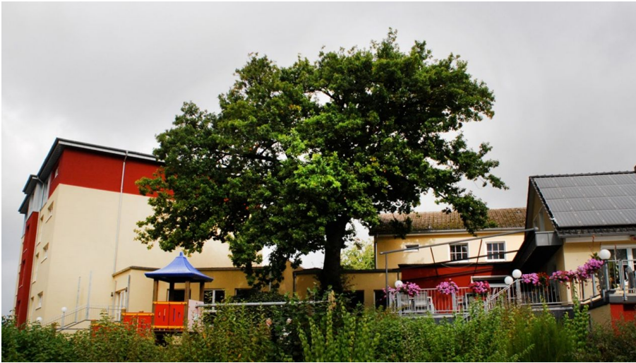
Hotel-Restaurant Weserschiffchen