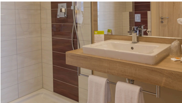
Hotel Weserschiffchen, Bad