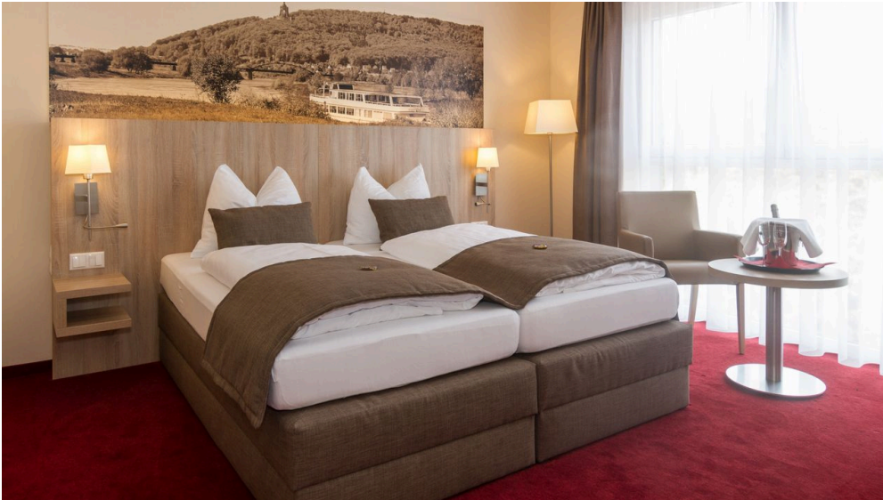
Hotel Weserschiffchen, Doppelzimmer Neubau