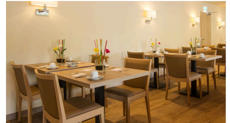
Hotel Weserschiffchen, Frühstücksraum