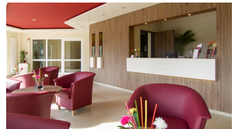
Hotel Weserschiffchen, Lobby-Rezeption