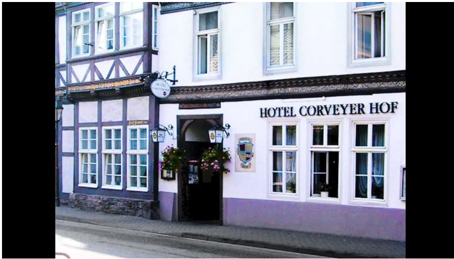
hotel-corveyerhof-hausansicht - © Hotel Corveyer Hof