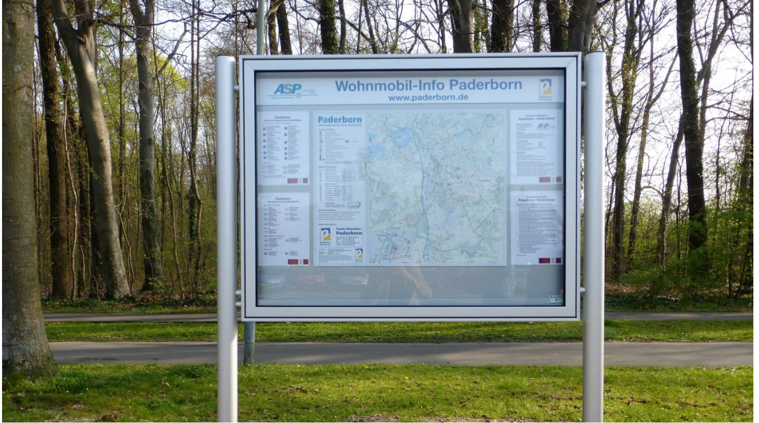
Informations-Schaukasten am Stellplatz