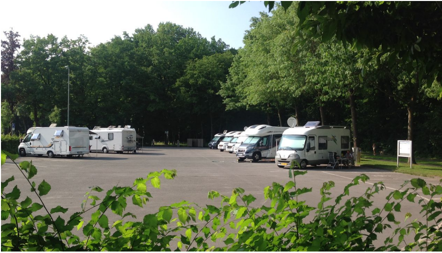
Stellplatz - Blick von Süden