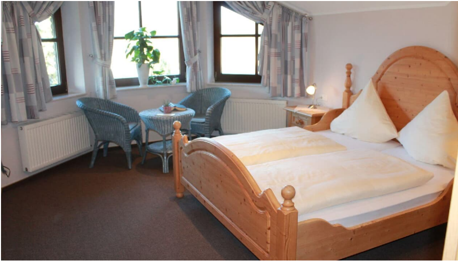
Landhaus Göke | Hövelhof