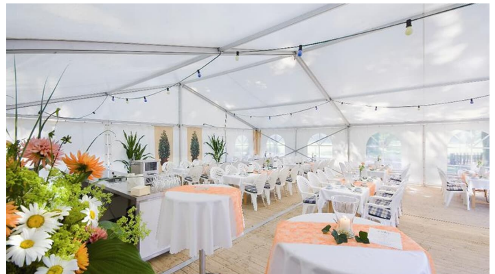
Zelt am Landhaus Göke