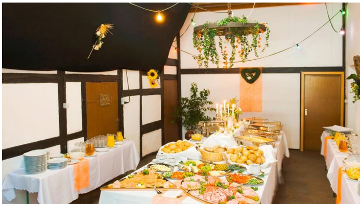
Buffet im Landhaus Göke

Kostenfreie Parkplätze an der Unterkunft