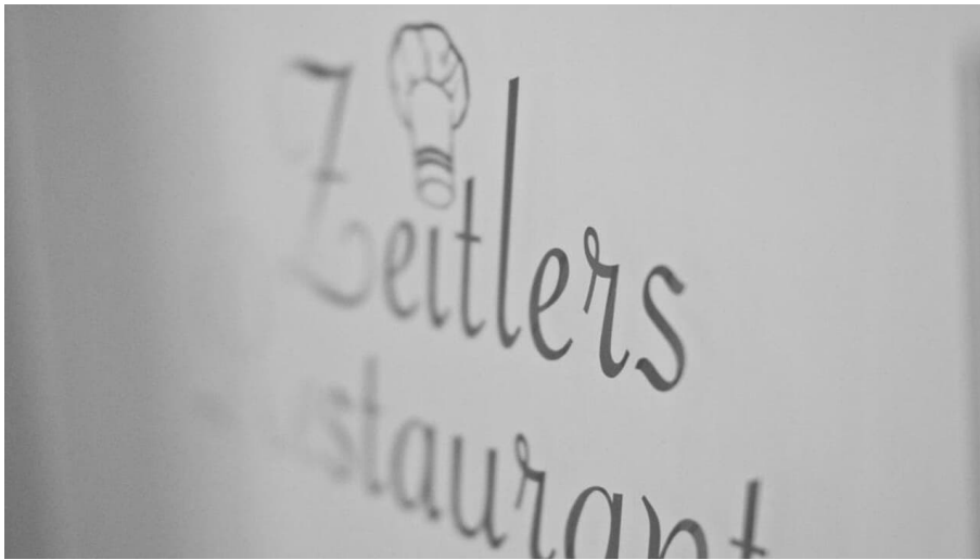
Eingangs-Logo Zeitlers Hotel & Apartments