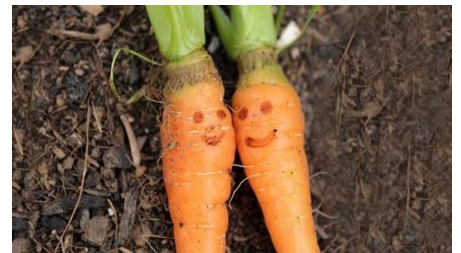
Lust auf Kochkurs in Zeitlers Hotel & Apartments