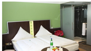
Zimmer in Zeitlers Hotel & Apartments