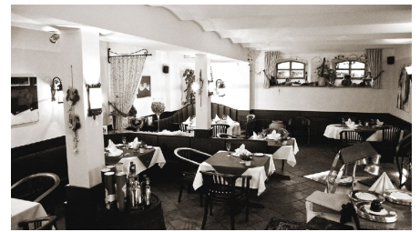
Restuarant in Zeitlers Hotel & Apartments