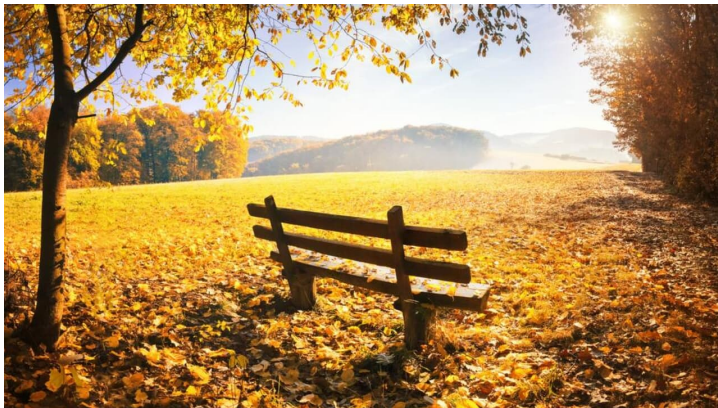
Bank im Herbst