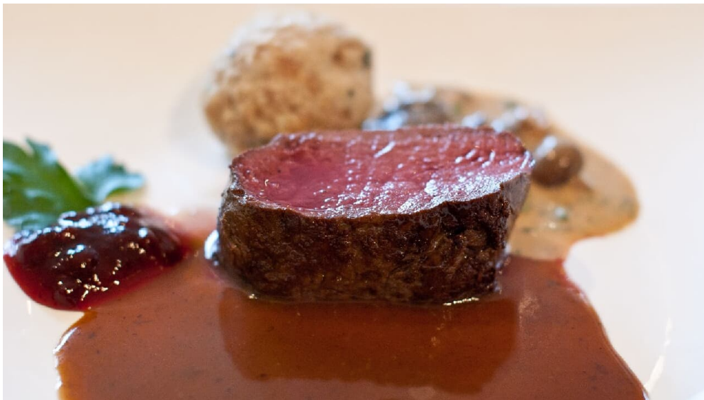
Fleischgericht in Zeitlers Hotel, Marsberg