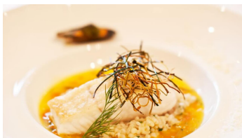
Fischgericht in Zeitlers Hotel, Marsberg