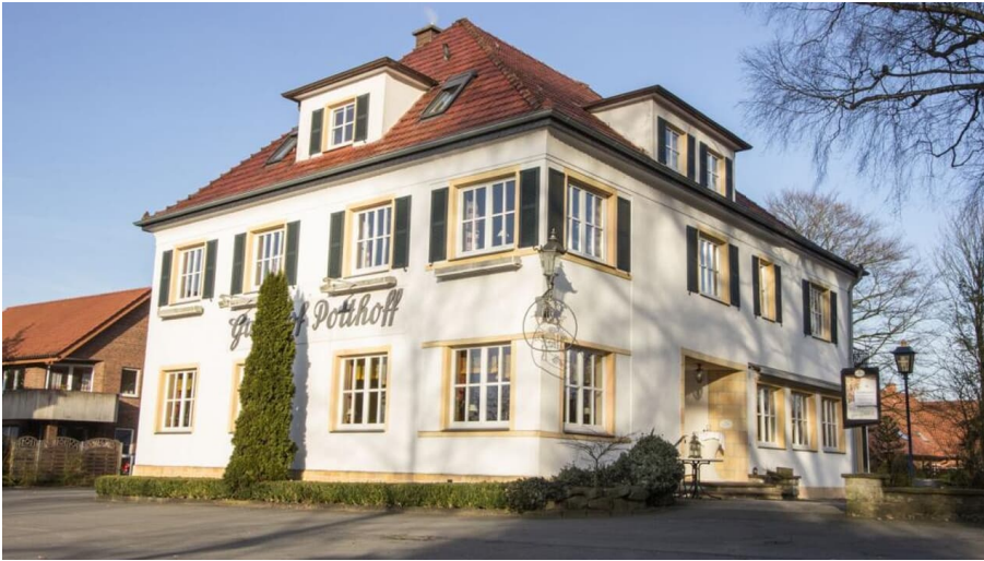
Außenaufnahme Landgasthof Potthoff, Borgholzhausen-Barnhausen - © Stadt Borgholzhausen