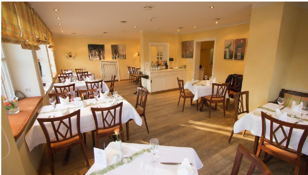
Restaurant, Landgasthof Potthoff, Borgholzhausen-Barnhausen