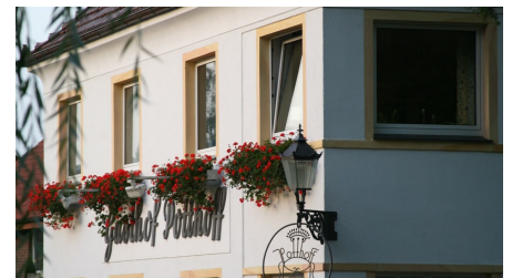
Landgasthof Potthoff