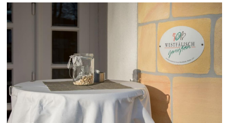
Westfälisch genießen im Landgasthof Potthoff, Borgholzhausen-Barnhausen - © Stadt Borgholzhausen