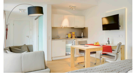
Apartments mit ca. 32 bzw. 50 m 2 Wohnfläche