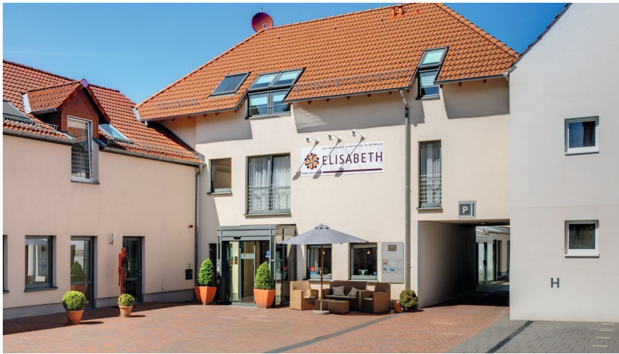
Außenansicht Hotel Elisabeth