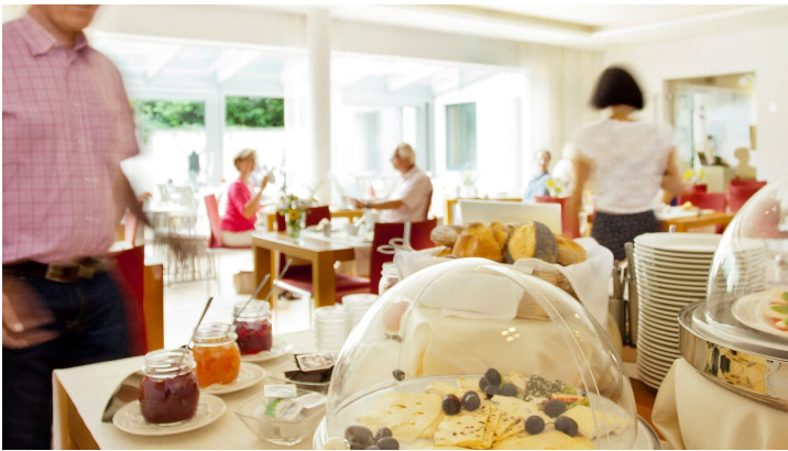
Unser reichhaltiges Frühstücksbuffet - © Alex Waltke, www.alex.waltke.de