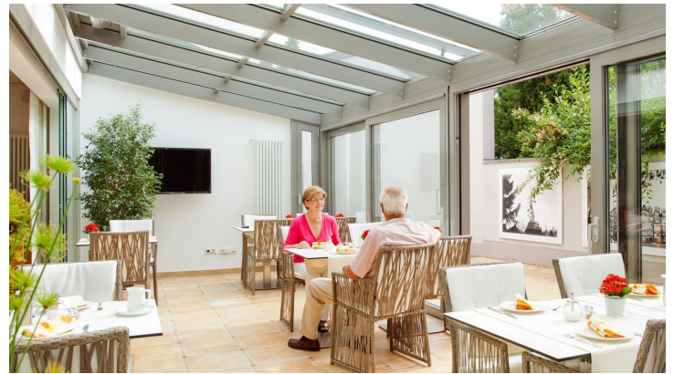
Frühstücksraum mit Wintergarten