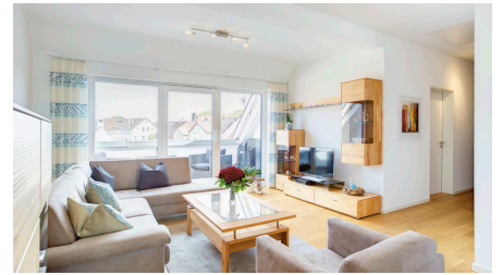
Ferienwohnung 100 m 2 mit Badewanne