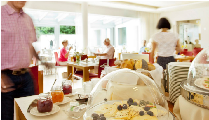
Unser reichhaltiges Frühstücksbuffet