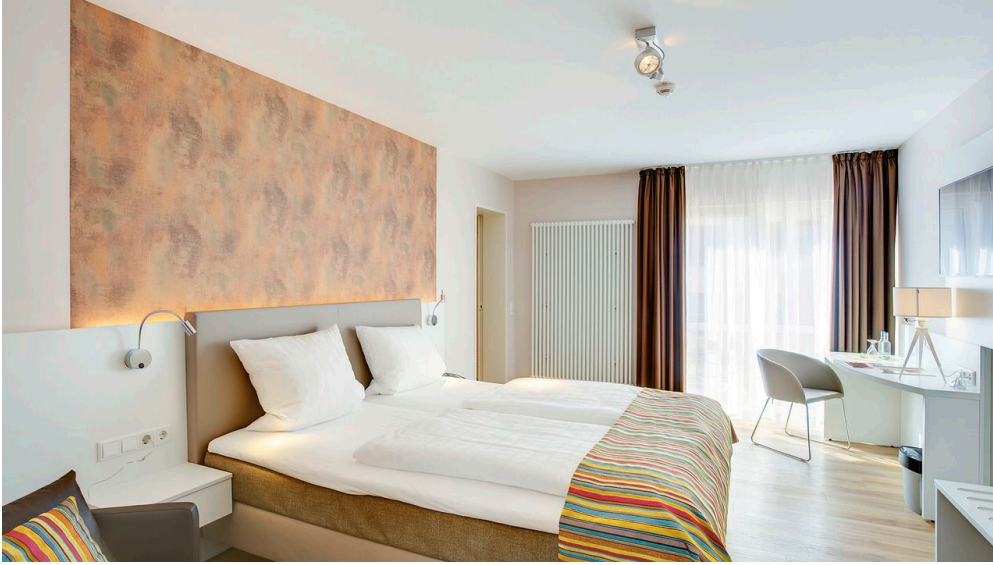
Komfort- und Superiorzimmer