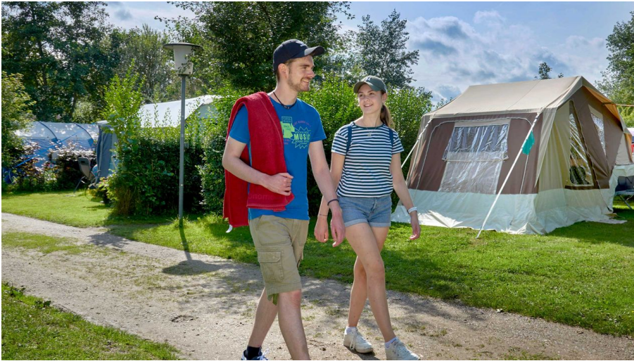
Camping in Dithmarschen (Symbolfoto)