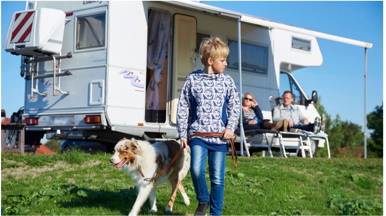
Camping in Dithmarschen (Symbolbild)