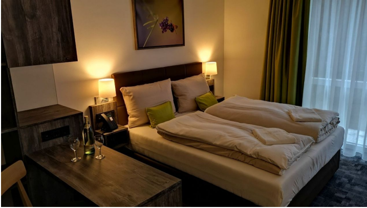
Doppelzimmer im Hotel Grünwalde, Halle Westfalen