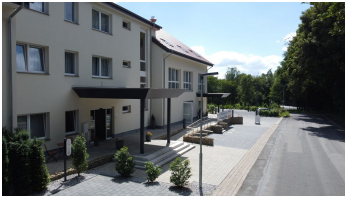
Eingang des Hotels Grünwalde