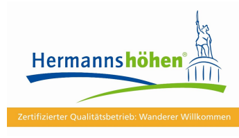
Qualitätsbetrieb der Hermannshöhen