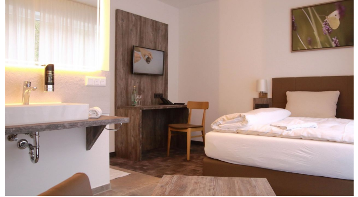
Zimmer im Hotel Grünwalde, Halle Westfalen