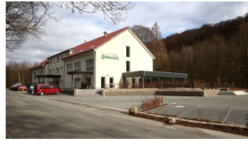
Hotel Grünwalde in Halle Westfalen - Aussenansicht