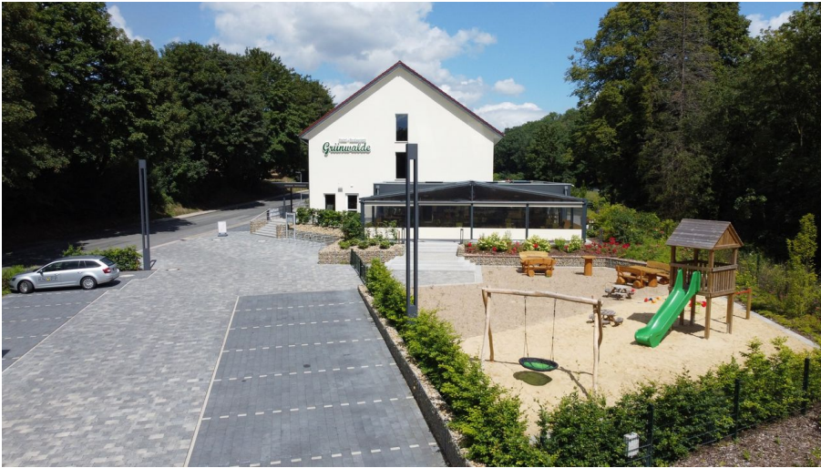
Außenansicht mit Parkplatz & Spielplatz