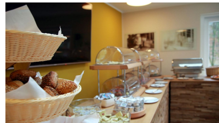
Frühstücksbuffet im Hotel Grünwalde, Halle Westfalen