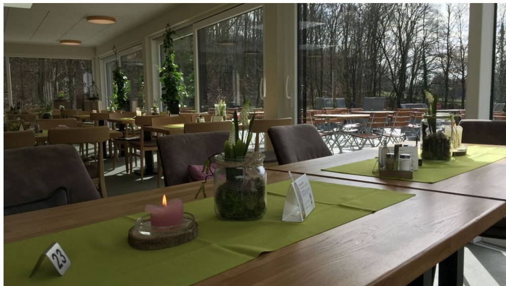
Wintergarten im Hotel Grünwalde, Halle Westfalen