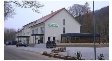
Hotel Grünwalde in Halle Westfalen - Aussenansicht