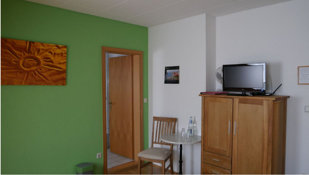
Altes Farmhaus Lienen_Zimmer_2000.jpg