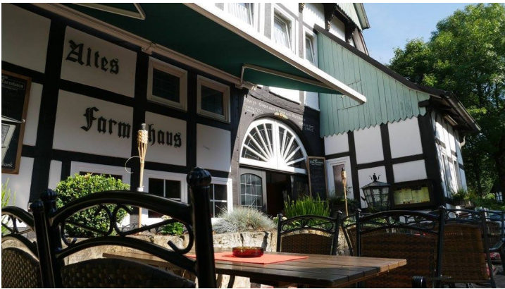
altes-farmhaus-lienen_familie-dierkschneider - © Altes Farmhaus , Lienen