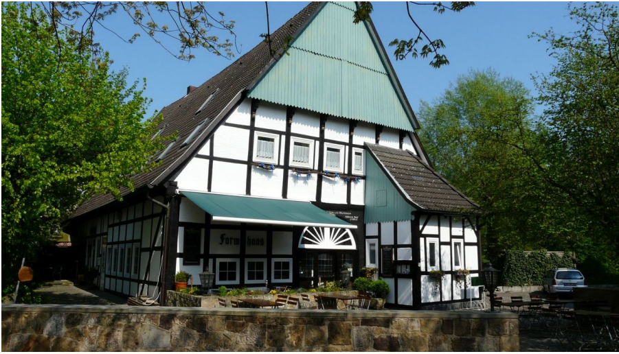
Altes Farmhaus Lienen_Frontansicht_Foto Dierkschneider.jpg