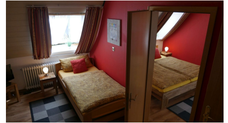
Zimmer mit Verbindung_Altes Farmhaus Lienen