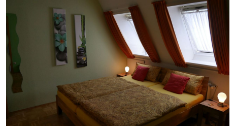
Doppelzimmer im Alten Farmhaus Lienen.jpg