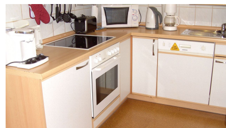
Küche in der Ferienwohnung Schünemann