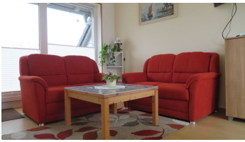
Wohnzimmer in der Ferienwohnung Schünemann