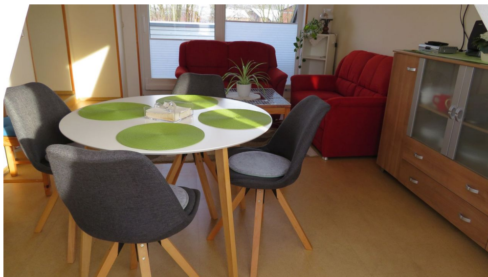
Essecke in Ferienwohnung Schünemann

Der traditionsreiche Bahnhof Altenbeken ist ein idealer Knotenpunkt zum Entdecken der Umgebung. Auch regelmäßige Busverbindungen Richtung Paderborn sind vorhanden.