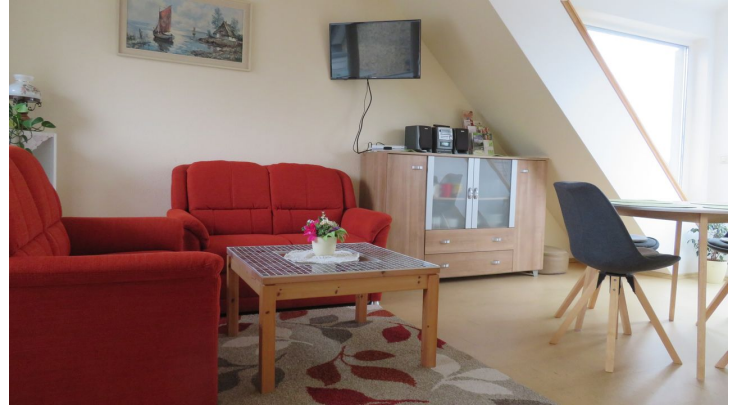
Wohnzimmer in der Ferienwohnung Schünemann