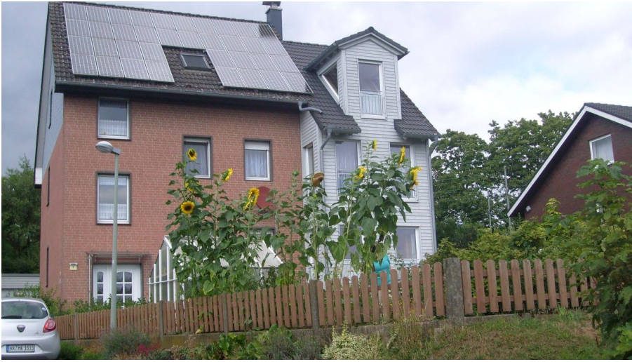
Ferienwohnung Schünemann in Altenbeken