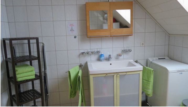
Badezimmer in der Ferienwohnung Schünemann