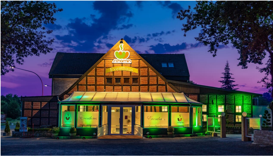
Dissen_Eventhaus Schamin_Aussenansicht_W_Schamin.jpg