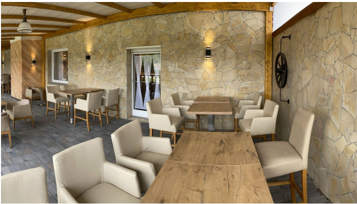
Dissen_Eventhaus Schamin_Veranda_W_Schamin.jpg - © Wasili Schamin