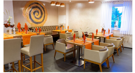
Dissen_Eventhaus Schamin_Restaurant_W_Schamin.jpg