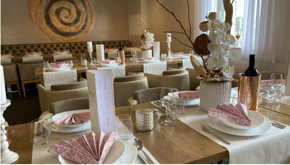
Dissen_Eventhaus Schamin_gedeckter Tisch_W_Schamin.jpg