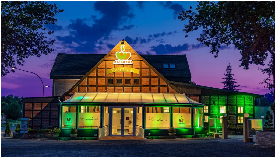
Dissen_Eventhaus Schamin_Aussenansicht_W_Schamin.jpg