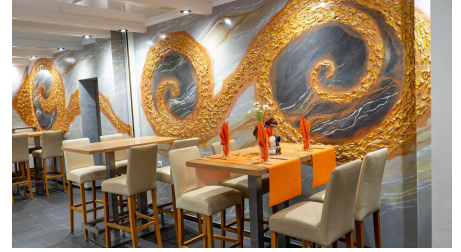
Dissen_Eventhaus Schamin_Restaurant 2_W_Schamin.jpg