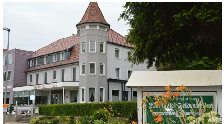
Hotel Felsenkeller_Bad Iburg_Teutoburger Wald Tourismus_I Bohlken (4)_3000.jpg