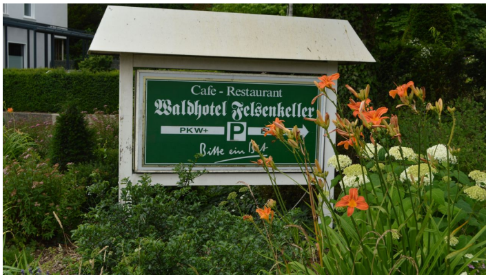
Hotel Felsenkeller_Bad Iburg_Teutoburger Wald Tourismus_I Bohlken (1)_3000.jpg