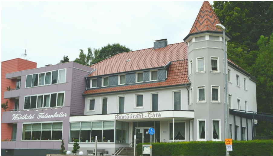
Hotel Felsenkeller_Bad Iburg_Teutoburger Wald Tourismus_I Bohlken (3)_3000.jpg