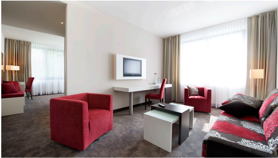
Westfalen Hof