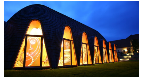
auerstedt_maloca_aussen_abend_ortwin_klipp - © Ortwin Klipp