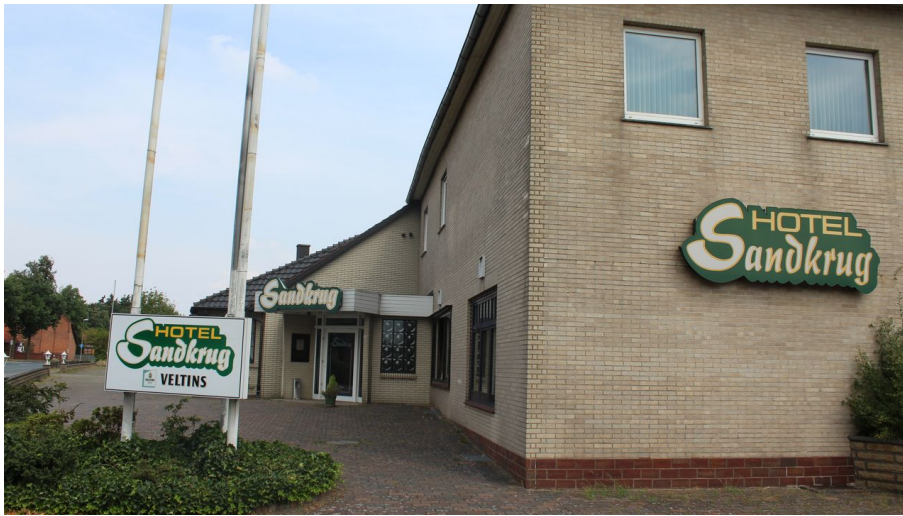
Hotel Sandkrug