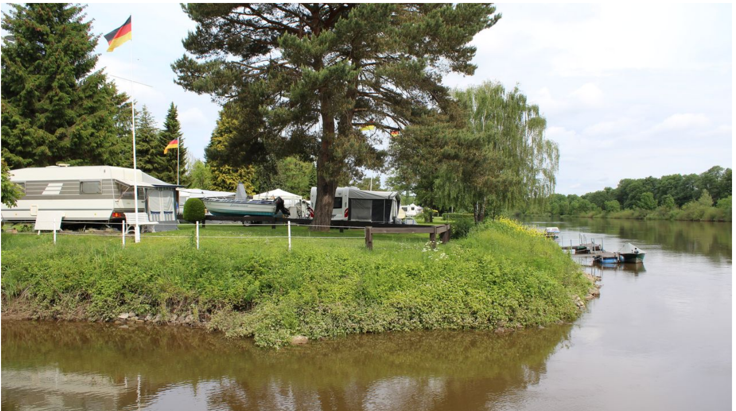
Campingplatz Stolzenau