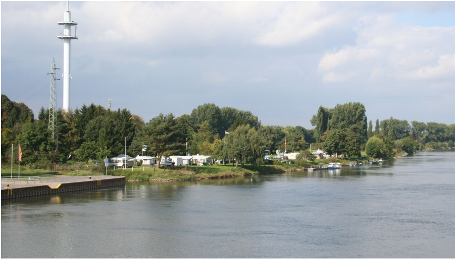
Campingplatz Stolzenau