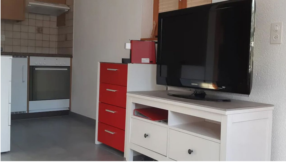
Küche und TV-Möbel