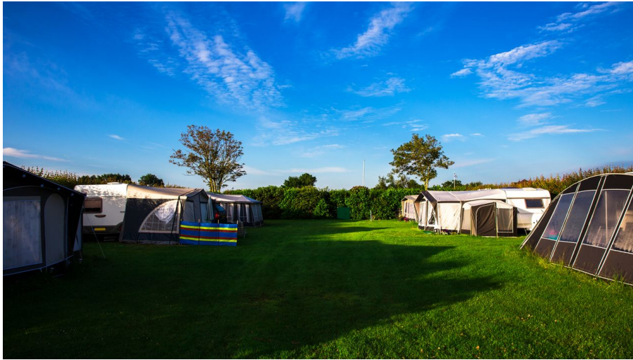
AdobeStock_253731083_Sebastian.jpeg