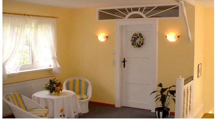
innen1.jpg · © Landhaus Saaleck