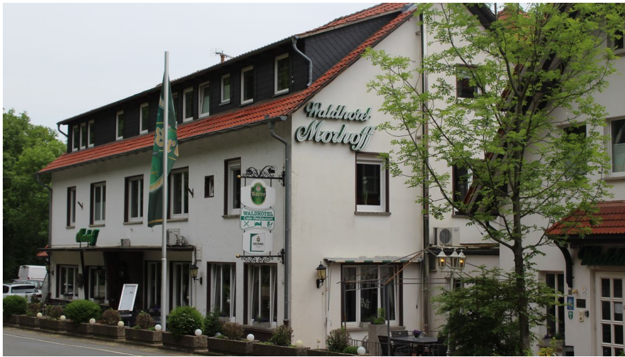
Balkes Morhoff