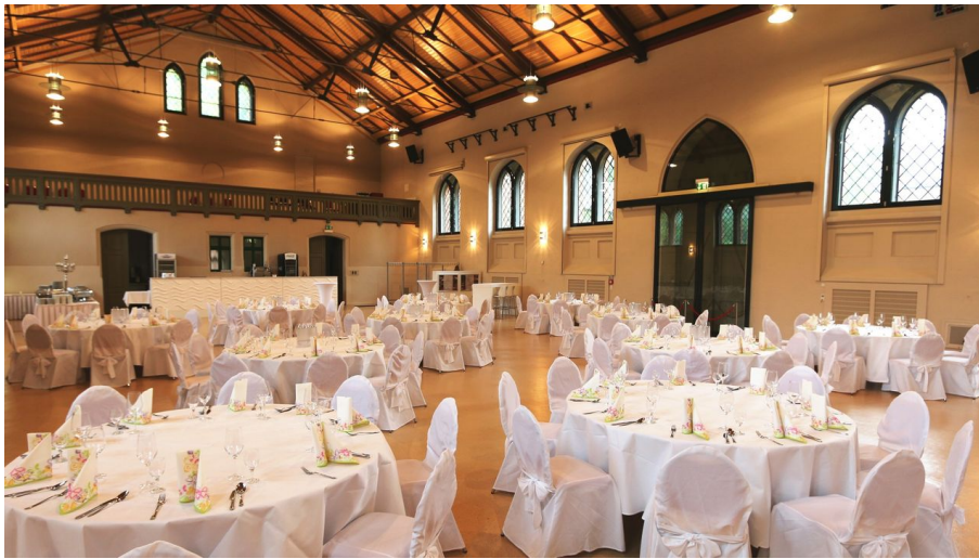
Fürstlicher Marstall Wernigerode - Bankett