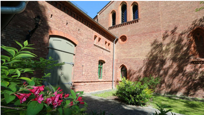
Fürstlicher Marstall Wernigerode - Eingang