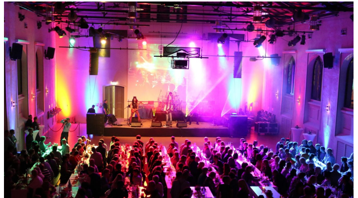
Fürstlicher Marstall Wernigerode - Stimmung