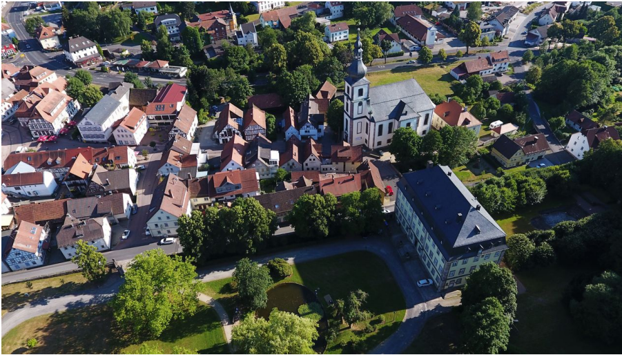
Gersfeld von oben