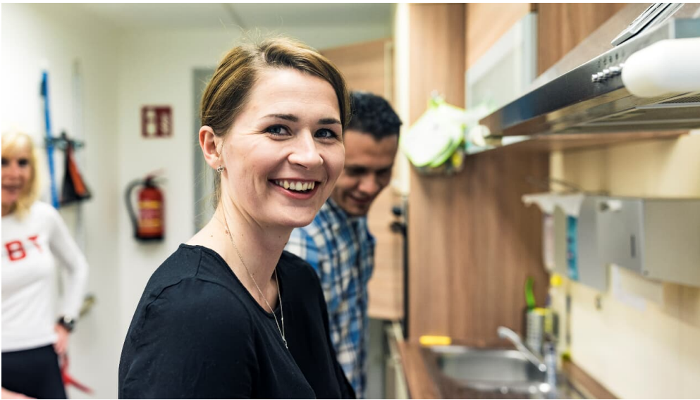
badHersfeld_Kochen Fr. Schmidt2_1958.jpg