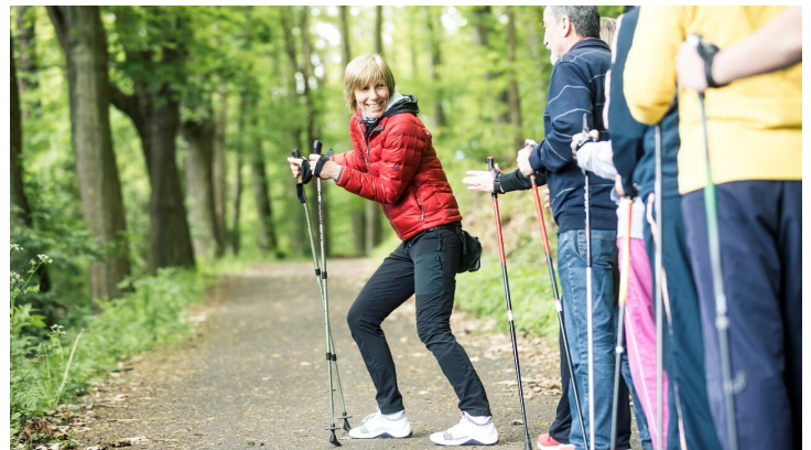
badHersfeld_Walking Fr. Sura2_1360.jpg