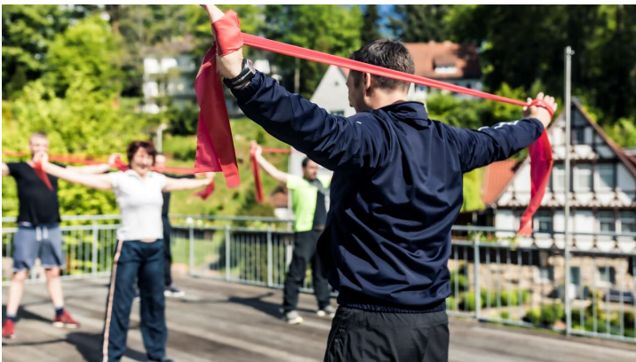
badHersfeld_Sportgruppe3_1237.jpg - © Median Kliniken GmbH