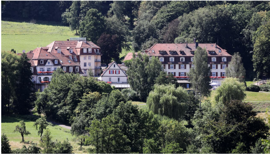
182HR - Bad Orb - Reha Kliniken Kuppelsmühle.JPG