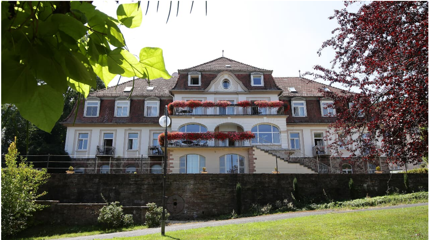
177HR - Bad Orb - Reha Kliniken Kuppelsmühle.JPG - © Heiko Rhode

Deutsch, Englisch, Italienisch, Russisch, Türkisch