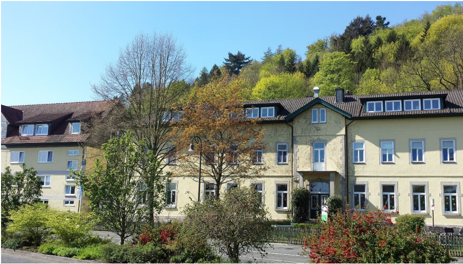
Klinik Werraland_Hausansicht