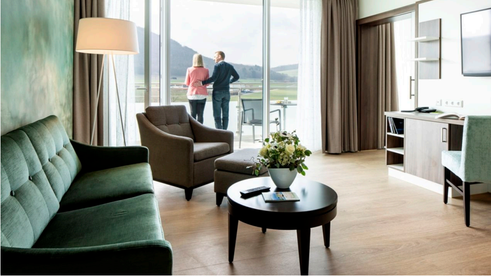
Zimmer QT.jpg