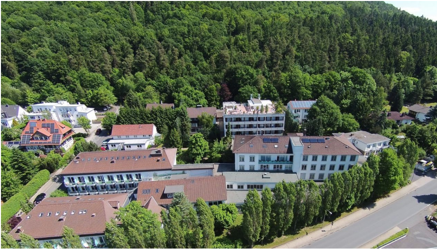
Klinik_RH_17 zugeschnitten ohne Focussiegel.jpg