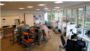
neuer Sportraum (7).jpg