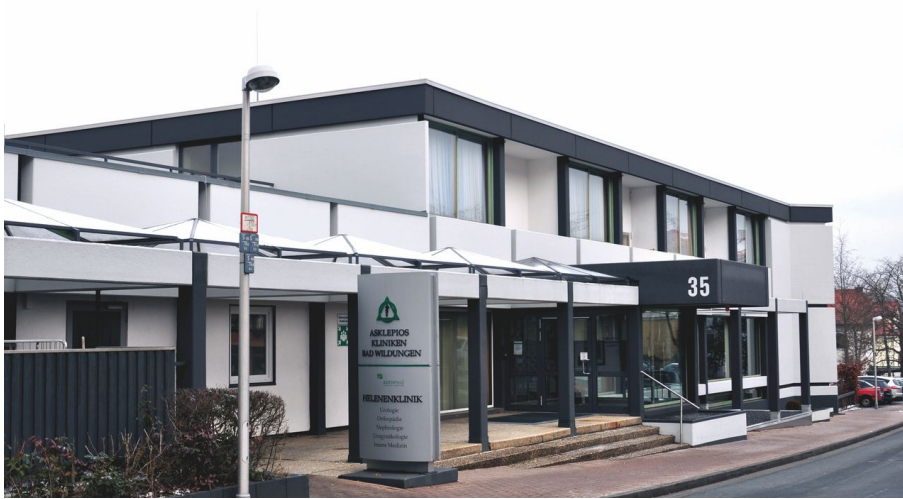
Helenenlinik Bad Wildungen-neu.jpg