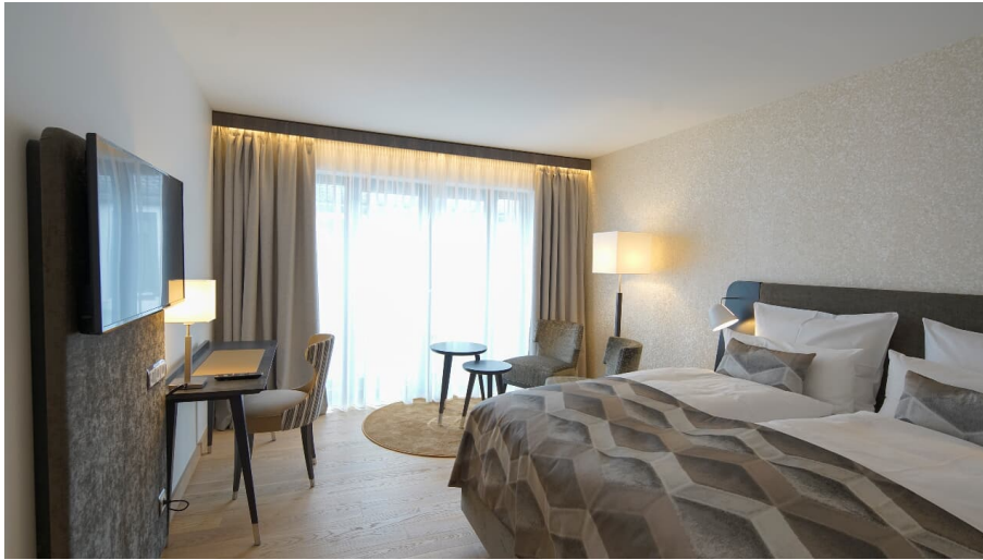
Essensio Hotel in Erkrath