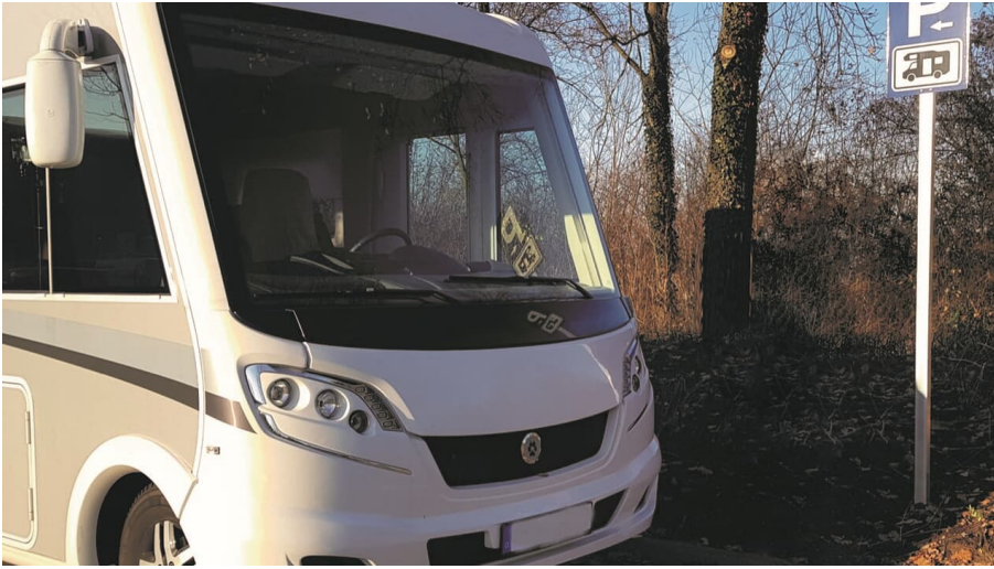
Wohnmobilstellplatz am Neanderbad in Erkrath