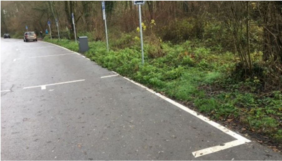
Wohnmobilstellplatz am Steinbruch in Haan-Gruiten