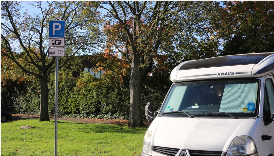
Wohnmobilstellplatz am Jahnstadion in Langenfeld