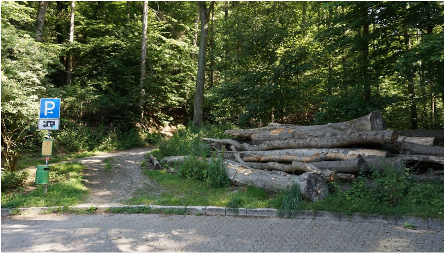
Wohnmobilstellplatz Nizzabad in Velbert