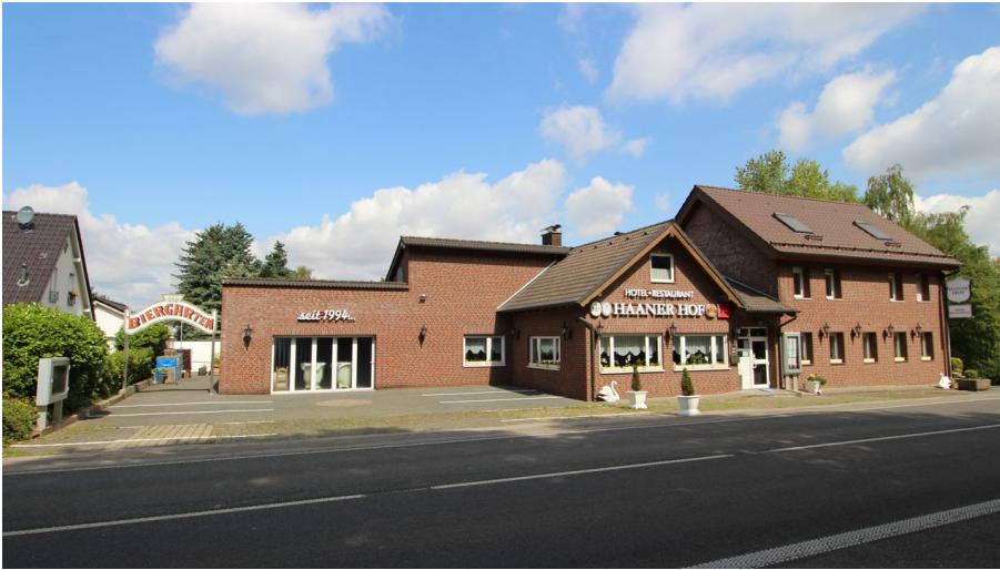
Hotel-Restaurant Haaner Hof