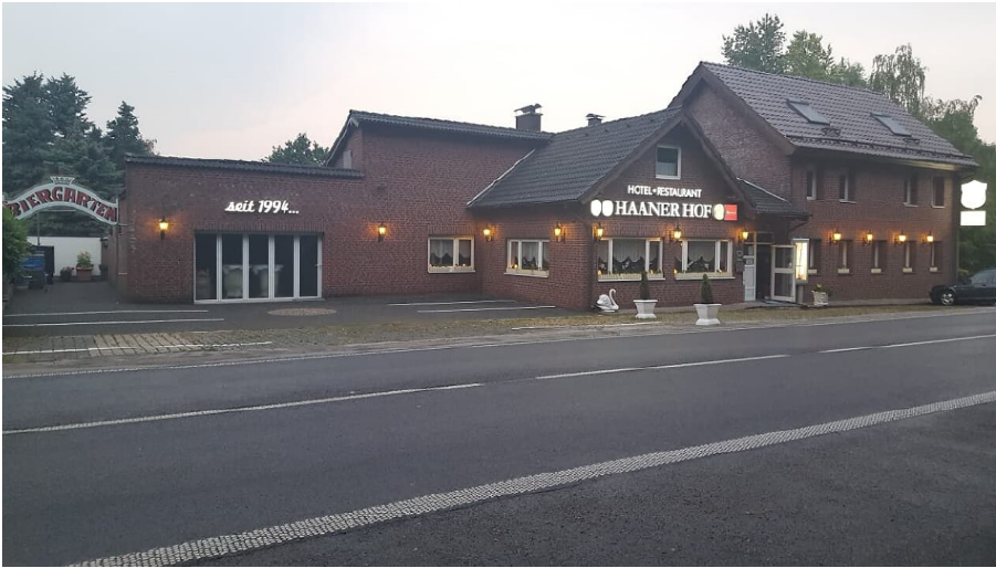
Hotel und Restaurant Haaner Hof