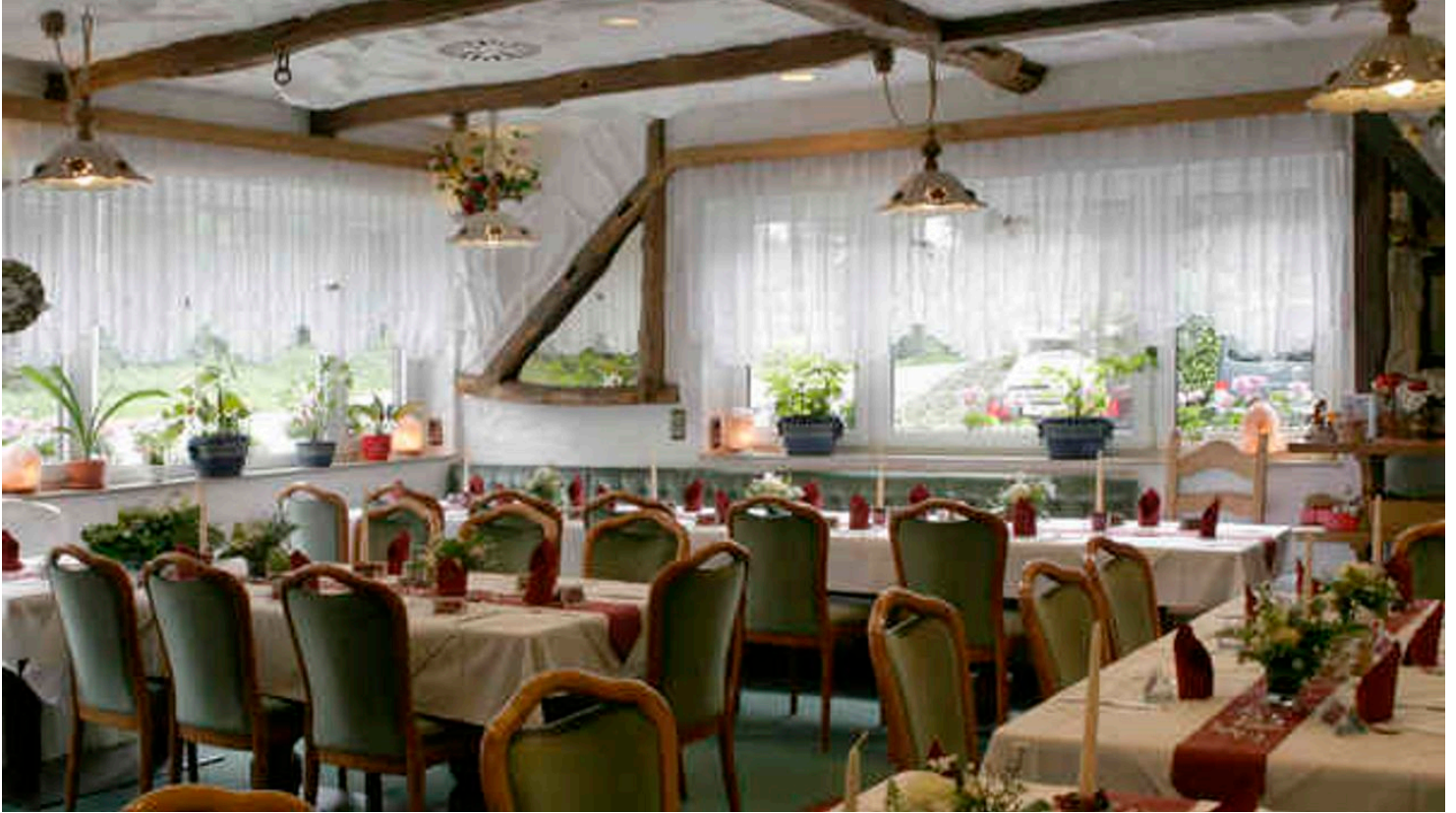
Gastraum im Hotel-Restaurant Haaner Hof in Haan