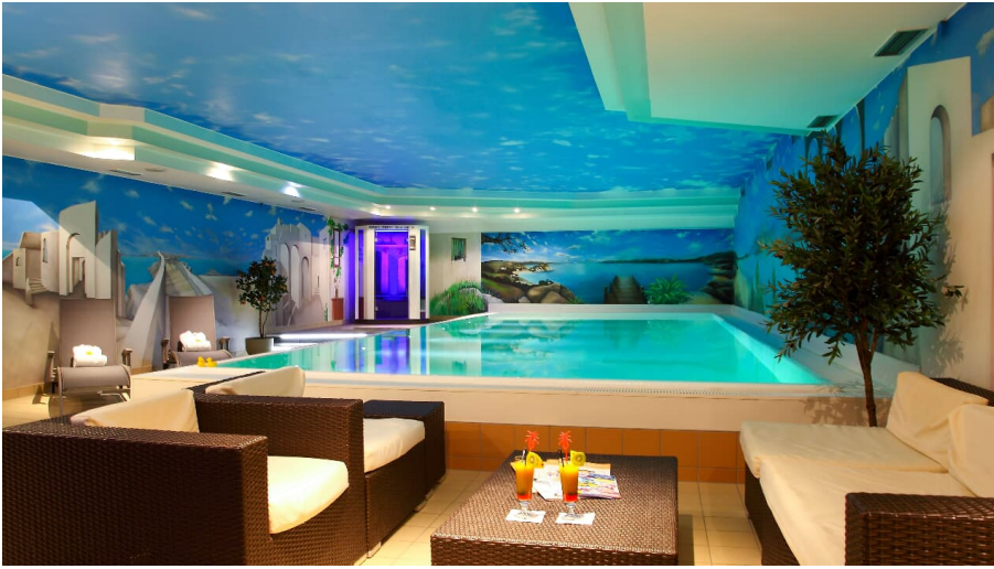
Best Western Plus Stadtquartier Haan - Wellnessbereich