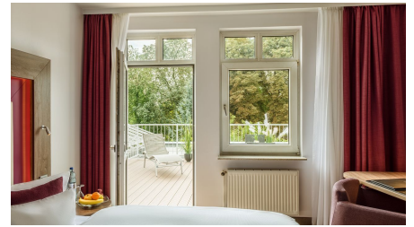
Parkzimmer im Best Western Plus Hotel Stadtquartier Haan