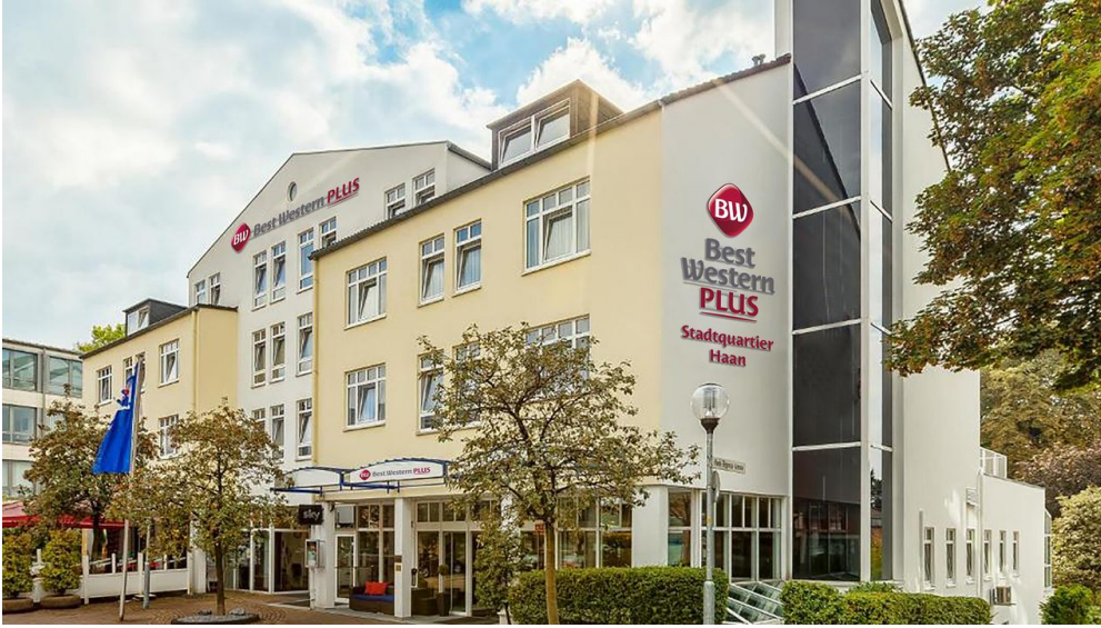
Best Western Plus Hotel Stadtquartier Haan