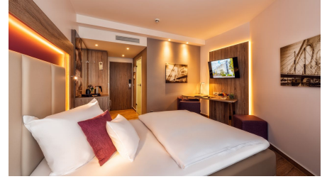
Stadtzimmer im Best Western Plus Hotel Stadtquartier Haan