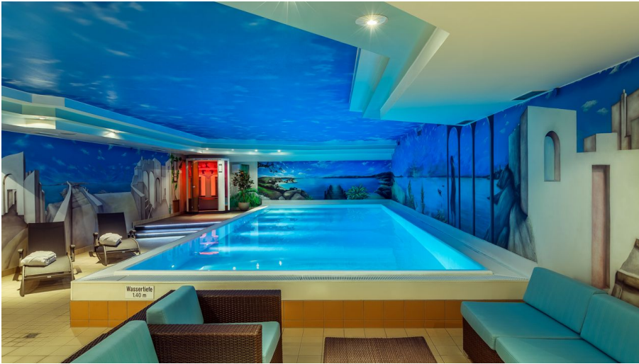
Wellnessbereich im Best Western Plus Hotel Stadtquartier Haan