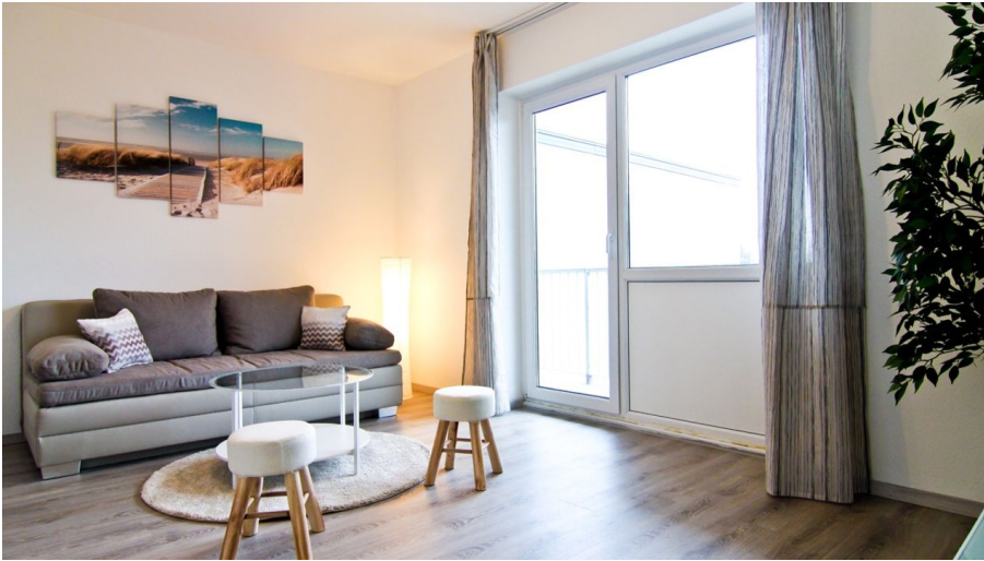
apartmondo Ferienwohnung in Heiligenhaus