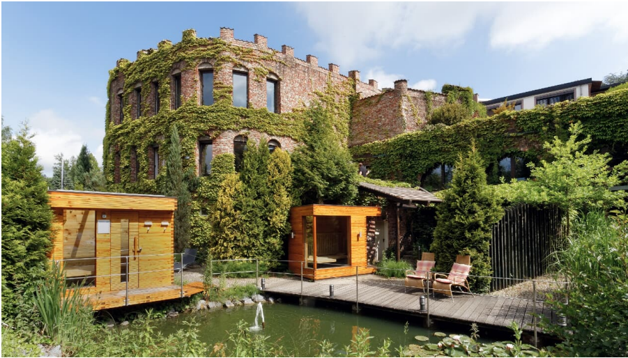
Land Gut Höhne in Mettmann