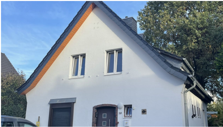
Ferienwohnung Henry´s Oak am Lönsweg 10 in Mettmann