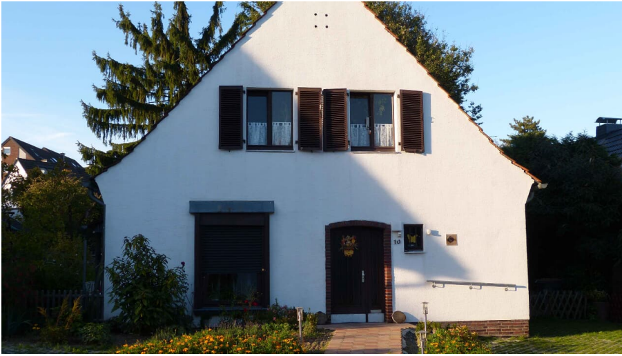
Privatunterkunft Henry's Oak I in Mettmann