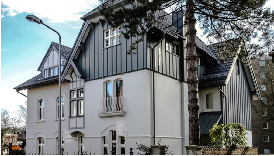
Fabrikantenvilla in Erkrath - © Fabrikantenvilla